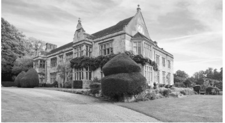
Manoir Haremere Hall