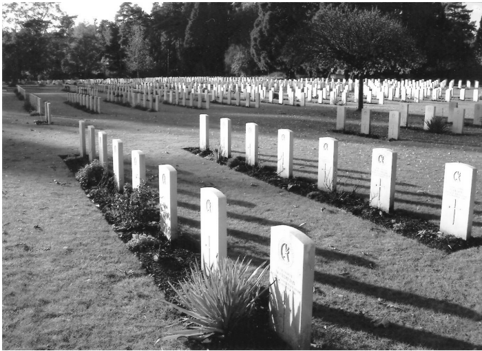
Cimetière de Brookwood, en Angleterre